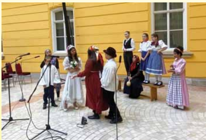
A bolond falu a Barokk Csarnokban