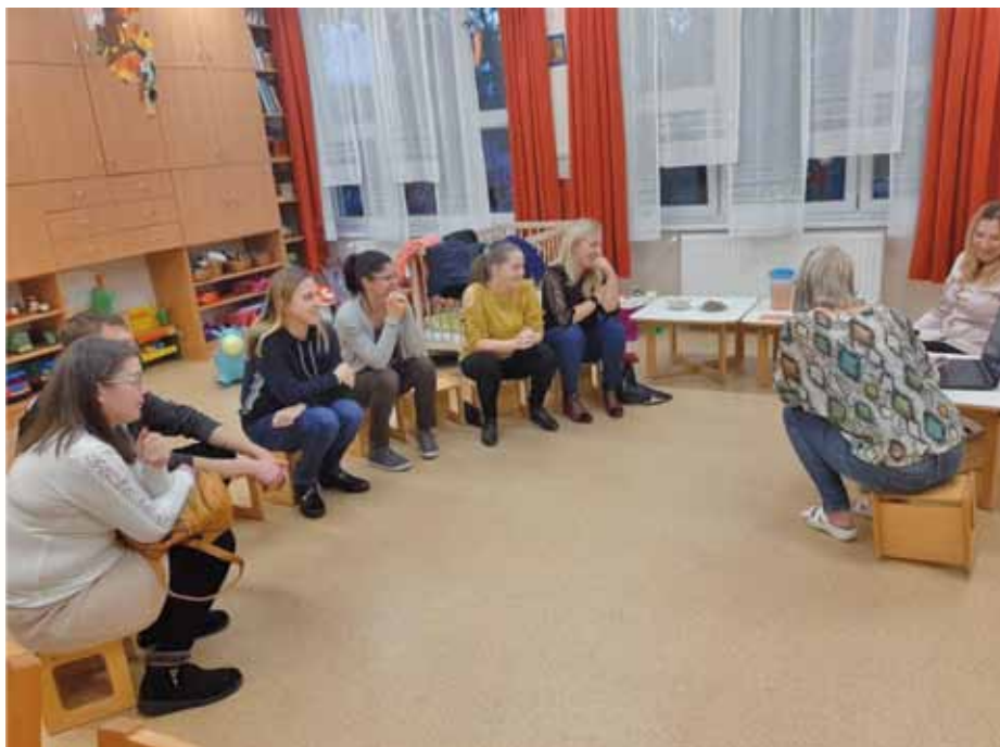
Pillangó csoportos szülők beszélgetése

A kisgyermek érzelmi élete tapasztalások útján gazdagodik. Saját élményei, a család eseményei egyre több érzelm megismerését, átélését teszi lehetővé. Az, hogy hogyan kezeli érzelmeit, hogyan fogadja be a körülötte történő dolgokat, meghatározza a személyiségét is. Az érzelmi és szociális fejlődése sokáig párhuzamosan halad. A bölcsőde a kisgyermek számára másodlagos szocializációs tér, a család kibővül a mindennapok során a kisgyermeknevelőkkel, dajkával, kis társaikkal. Az hogy a gyermek hogyan viselkedik, érez, cselekszik, az mind a családi háttér viselkedésének tükröződése. A bölcsődei élet