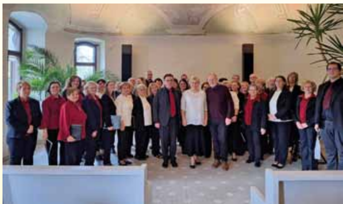
A szécsényi és a gyulai Erkel Kórus hangversenye az Almásy kastélyban