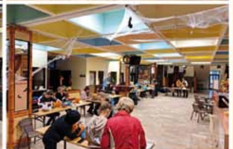
Pillanatképek a Tök jó délután programról