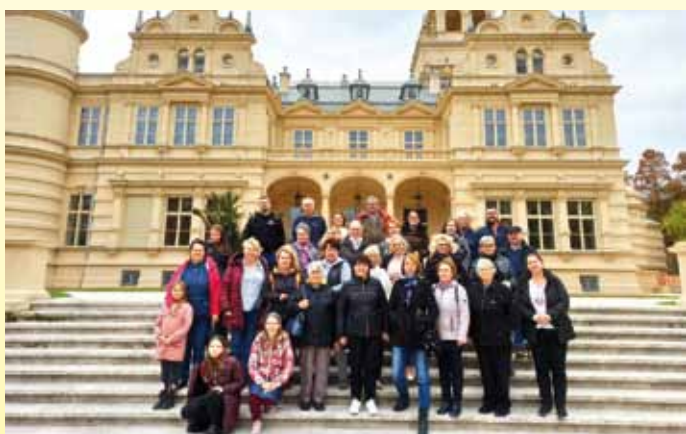
A kórus a szabadkígyósi Wenckheim kastélynál