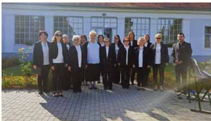
Az Erkel Vegyeskar a csesztvei Madách ünnepségen

kező rendezvénysorozatnak. Szerepeltünk a szülőházából kialakított emlékházban, meghallgattuk az ünnepi hangversenyt, énekeltünk az Erkel-szobor megkoszorúzásánál és a helyi Erkel Ferenc Vegyeskarral közös koncertet adtunk az Almásy kastélyban. A fellépések mellett kikapcsolódásra is