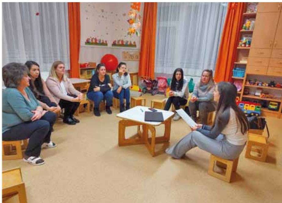
Katica csoportos szülők beszélgetése

A játék mindig örömet szerző tevékenység, még akkor is, ha ennek éppen nincsen látható jele. Egy önmagáért történő tevékenység, amely spontán és önkéntes a gyermek részéről. Rengeteg készség kialakulásával van összefüggésben a játék, például a gondolkodással, beszéddel, problémamegoldással, kreativitással, társas kapcsolatok alakulásával is. A gyermek a játékon keresztül ismeri meg a világot, segít feldolgozni neki érzéseit, élményeit.