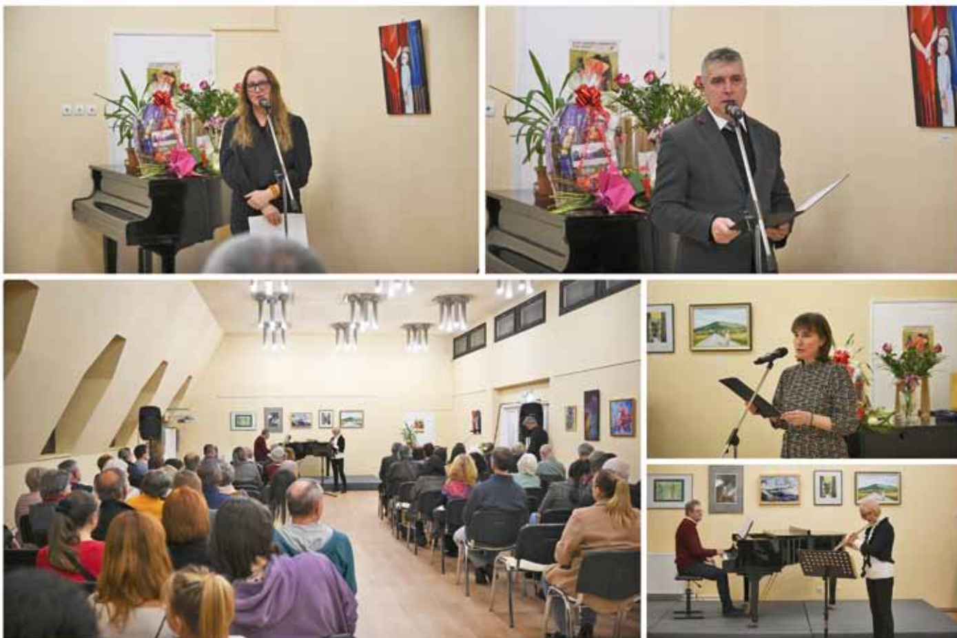
Pillanatképek az őszi tárlat megnyitójáról