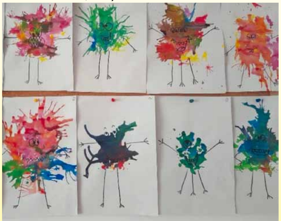
Gyermekek által készített alkotás: „Baktériumok”