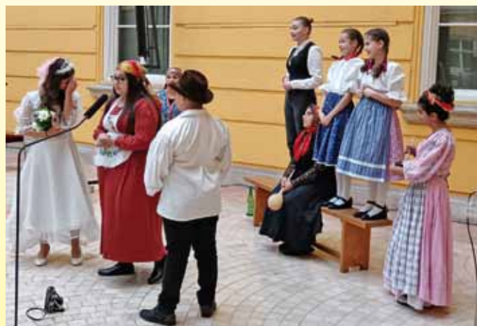
A színjátszók előadás közben