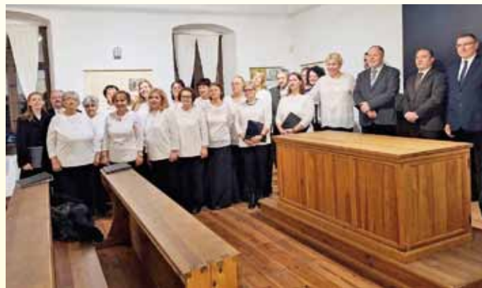
A kórus az Erkel Emlékházban