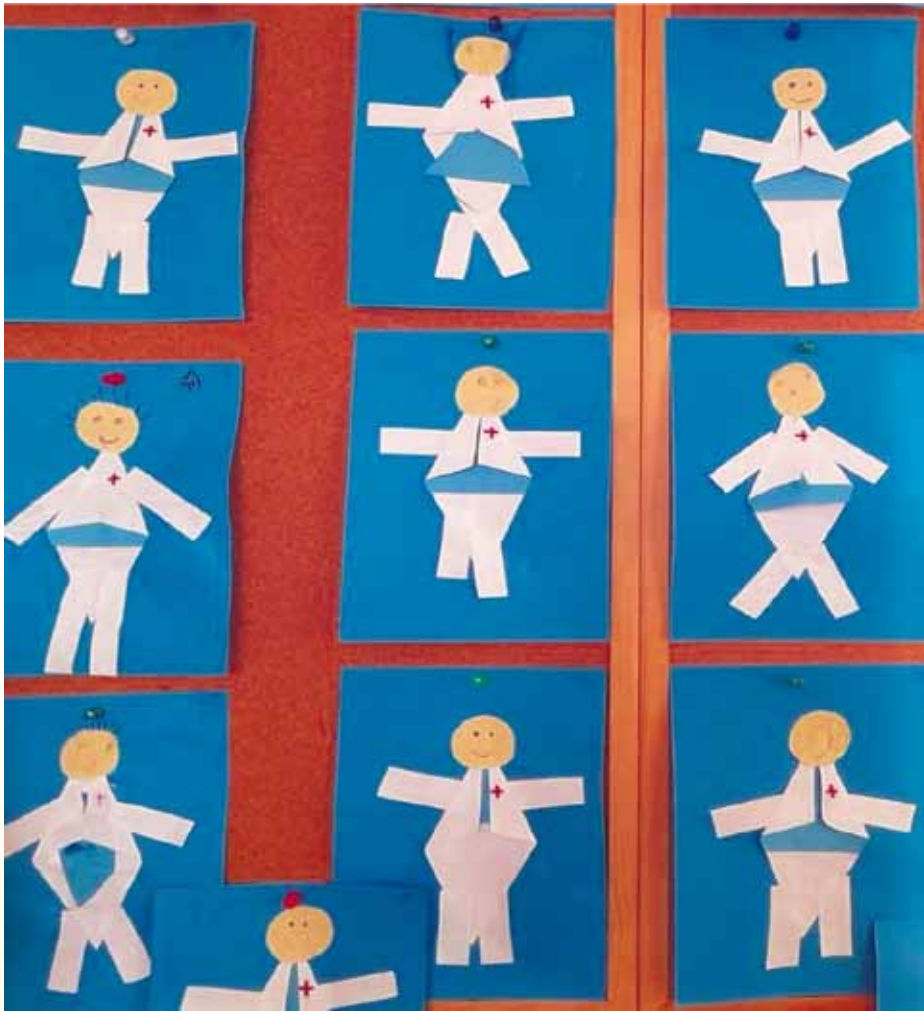
Gyermekek által készített alkotás: „Doktor bácsi”

a megfelelő mozgás szerepére (akár szabad levegőn, akár tornateremben). Intenciónk az volt, hogy a gyermekek egészséges életmód iránti érdeklődésüket felkeltsük és megalapozzuk.