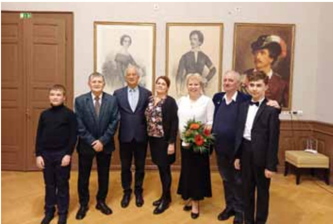
Szent Márton koncerten az erdélyi és felvidéki díszvendégekkel