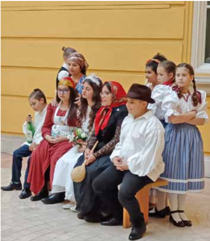
Fotóbeállítás a jelenet elején