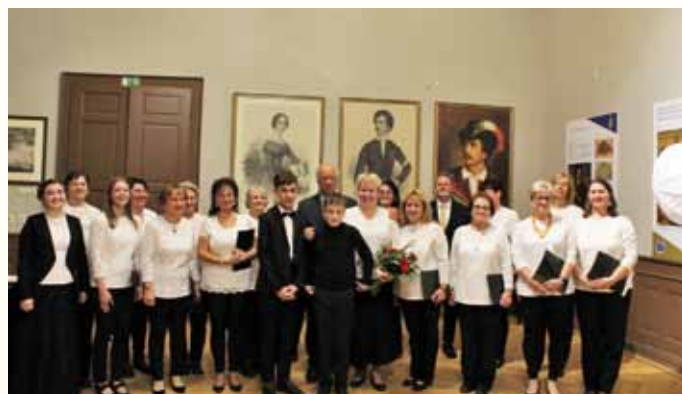
Szent Márton koncerten a kórus