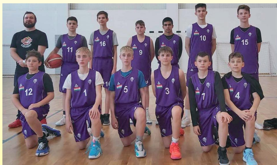
SKSE - U14