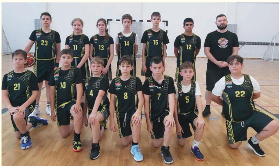
SKSE - U13