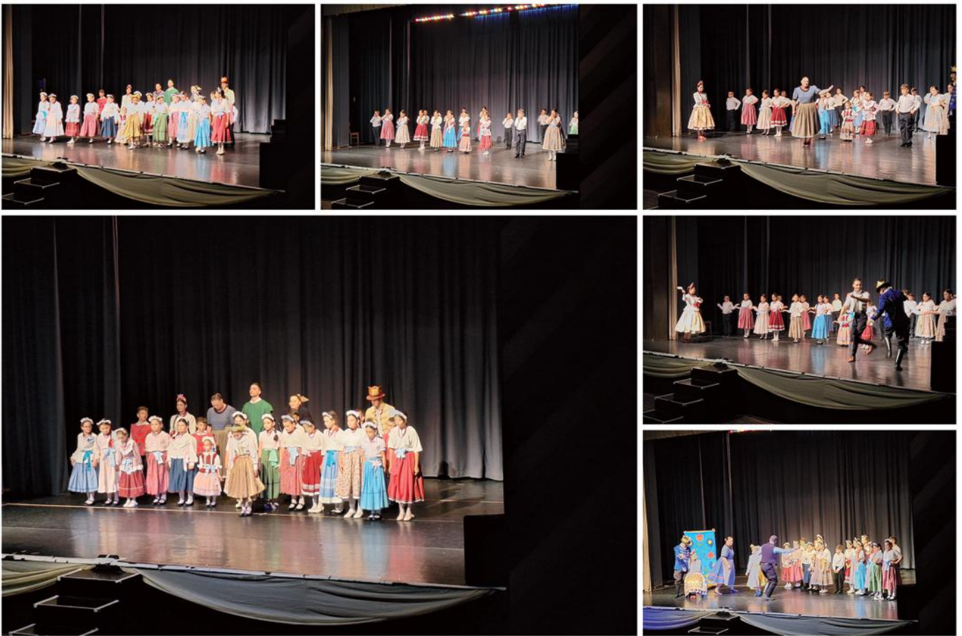
Az aranymadár előadás