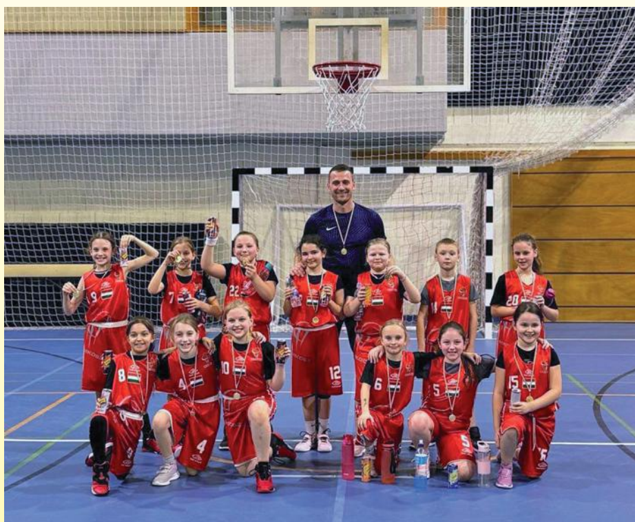
Pesák - U10

Az U14-es regionális fiú bajnokságban már több mérkőzésen, komoly bajnoki mezőnyben kellett megszerezni a győzelmet, itt a salgótarjáni korosztályos játékosokkal közösen alkotunk egy csapatot. Az alapszakasz és a felsőház mérkőzéseinek sikeres