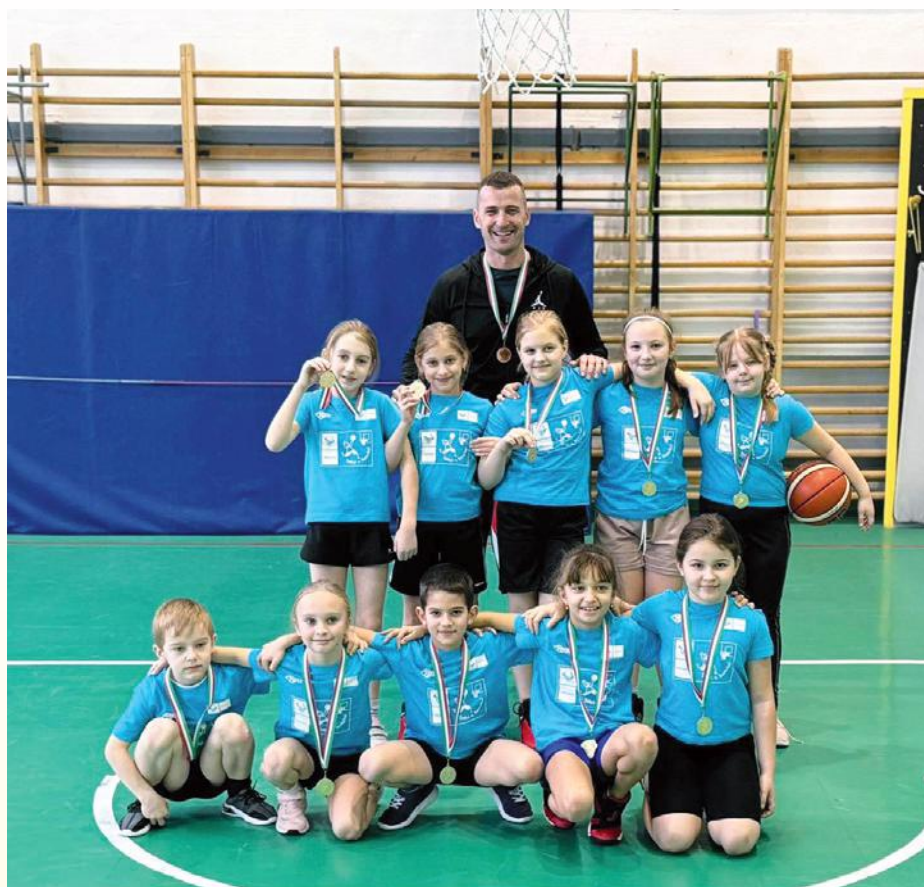
Dobd a kosárba

A 2023/2024-es szezon igen eredményes volt a szécsényi kosárlabdát illetően. Több korosztályban és nemben képviselték városunkat a gyerekek. A legkisebb korosztály (1-2. osztály), a „Dobd a kosárba” program eseményein ismerkedtek a sportág alapjaival. Őket követték a 3-4. évfolyamos gyerkőcök, akik a programon túl, a Bárkányi DSE színeiben próbálgatták szárnyaikát a Pest Megyei U10-es bajnokságban. A Salgó Basket Szécsény U13-as lányai is megdolgoztak a sikerért, ugyanis a Pest Megyei Leány U13-as bajnokságban az előkelő 3. helyezést hozták el. Ezt a lendületet megtartva, ugyanez a keret a Páter Bárkányi J. Katolikus Általános Iskola színeiben meg sem állt a Diákolimpia Országos Elődöntőig, ahol nagy csa-