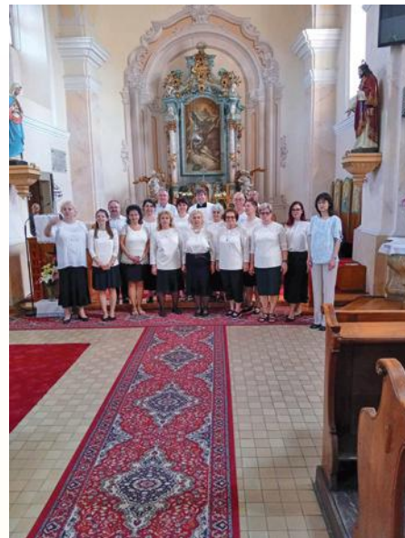
Erkel Vegyeskar az ipolyvarbói szentmisén