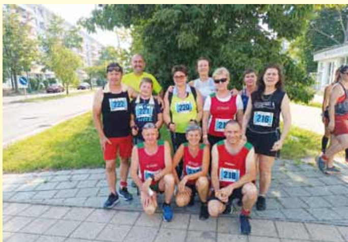
XI. Ipoly futás Losonc - Rapp

2023.08.27. Budapest 10 km Hősök futása futóverseny az atlétikai világbajnokság hivatalos férfi maraton versenye után, va-