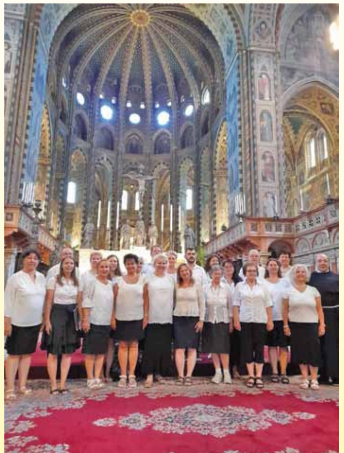
A kórus a páduai Szent Antal bazilikában