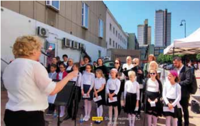
Holokauszt ünnepség Salgótarjánban