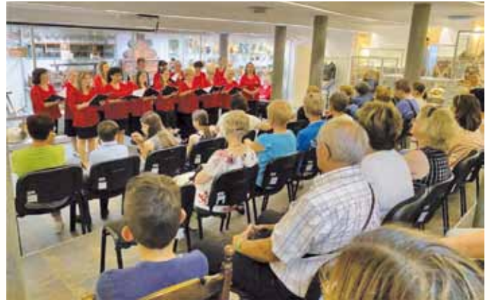
Szent Iván éji koncert a balassagyarmati Palóc Múzeumban

Az idei nyár sem csak a pihenésről szóló kórusunk számára, hiszen számos helyszínen mutathattuk be énekeinket. A hagyományos programok és ünnepi alkalmak mellett új felkéréseket is kaptunk.