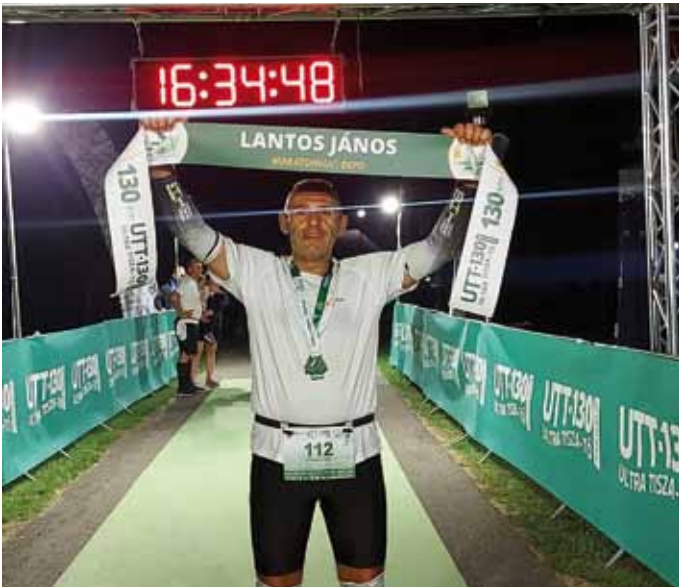
Ultra Tisza-tó futóverseny Tiszafüred

sárnap 11 órakor kezdődött. A verseny előtt a SZÁFT csapatát meghívták a BSI szervezői a szurkolói zónába. Hatalmas élményben volt részünk, láthattuk és