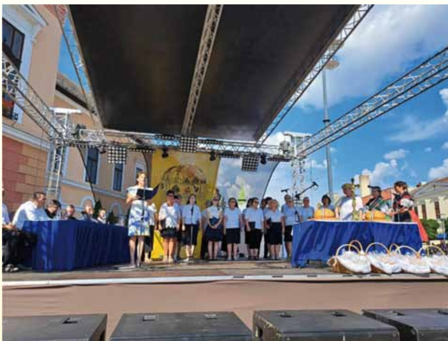
Balassagyarmat augusztus 20.

Augusztus 20-án Balassagyarmaton léptünk fel a Szent István napi ünnepi műsorban.