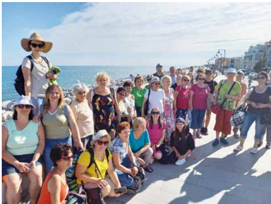
A kórus Olaszországban, Caorle-ban