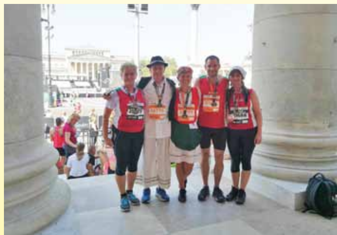
Hősök futása atlétikai világbajnokság