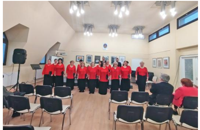
Az Erkel Vegyeskar szécsényi Zenei Világnapi hangversenyen

Köszönjük karnagyunk fáradhatatlan munkáját, hogy ismét ilyen csodálatos élményekhez juttatott minket! Hálásak vagyunk közönségünknek és támogatóinknak is, hogy együtt élhettük át ezeket a felejthetetlen pillanatokat!