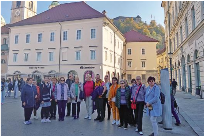
Az Erkel Vegyeskar Ljubljana főterén