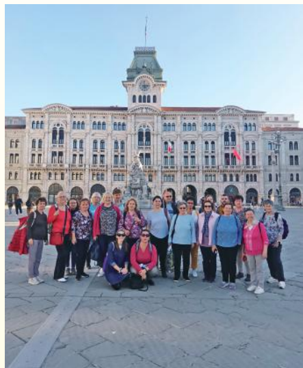
Az Erkel Vegyeskar Triesztben