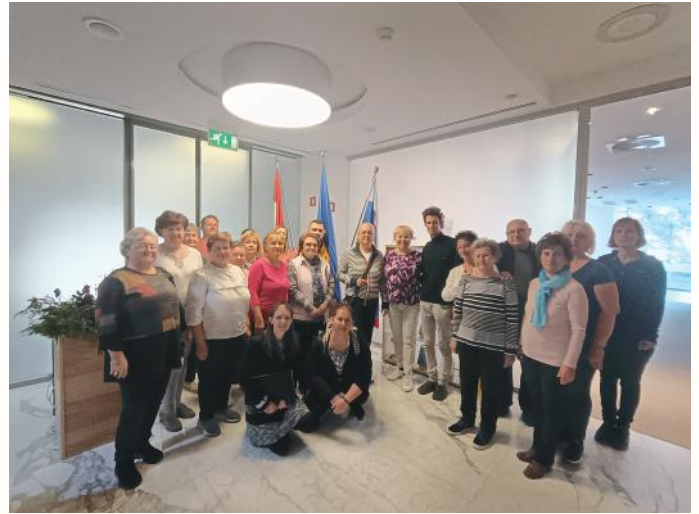
Az Erkel Vegyeskar a szlovén-magyar Liszt Kulturális Intézetben

Az idei ősz nemcsak az időjárás, hanem a zenei programok terén is igen változatosan alakult számunkra.