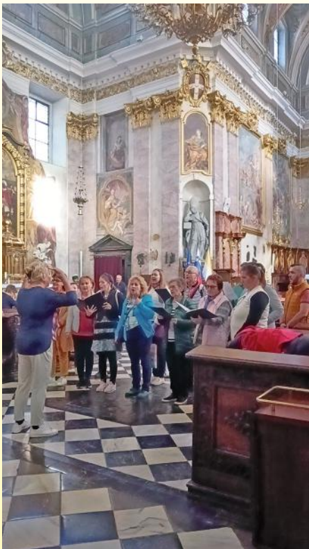
Az Erkel Vegyeskar a ljubljana Szent Miklós Főszékesegyházban

♪ Szeptember 15-én a XVIII. Ars Sacra fesztivál rendezvénysorozatához kapcsolódva megtartot-