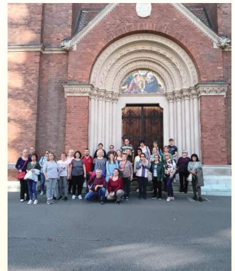
Az Erkel Vegyeskar a maribori Ferencesrendi templom előtt