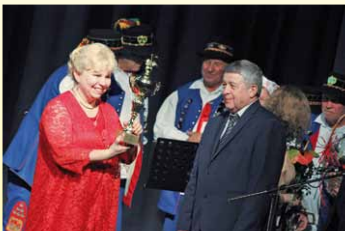
Ünnepi kehely a lengyel Tyczyn Város Polgármesterétől

Családok Évében alapította meg a Kopp Mária Intézetet, melynek névadója mutatta ki egy kutatásában, hogy a térségben egyedülállóak vagyunk a közösségi szemlélet elutasításában. A hamis szocialista kollektívizmust Magyarországon felváltotta a teljes individualizmus kora, ami Kopp Mária szerint egyszerre áldás és átok. Áldás, mert mindenki szeretne valamit elérni, megvalósítani, „valahogy kiugrani, másképp csinálni valamit”, ami komoly lehetőséget jelent, mivel „sok újító energia van”. Átok ugyanakkor, mert ha nem párosul közös, mindenki által elfogadott értékekkel, az individualizmus egymás ellen fordíthatja az embereket és így