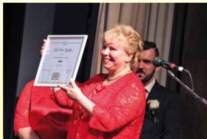
A kórus Nívódíja a Palóc Coop Zrt-től