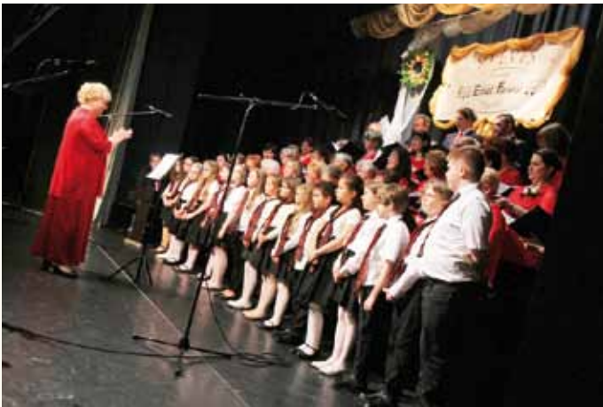
Szécsény Város Gyermekkara