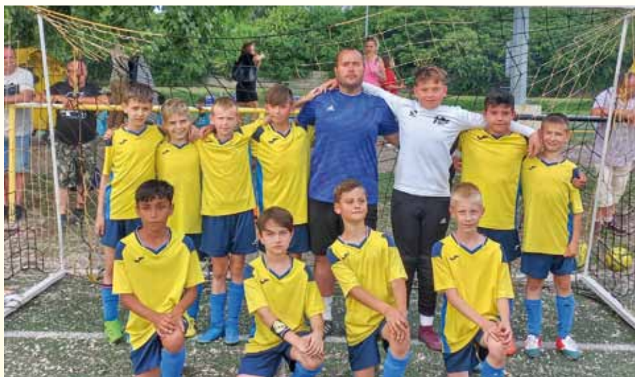
U11 pünkösdi csapat