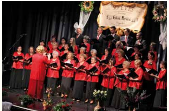
Erkel Vegyeskar - Szécsény

F antasztikus est, ünnepi hangverseny, a szeretet és a tisztelet megannyi megnyilvánulása!