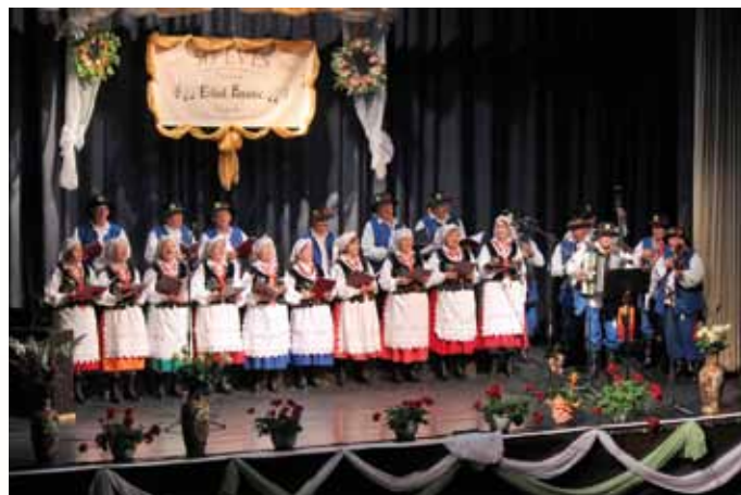
Lengyel kórus és zenekar

ragyogó korszaka, megalkotva a társas magány erkölcsi rendszerét, az „ének” önző mindenségét. Ezzel állt szemben 50 évvel ezelőtt itthon a szocialista kollektívizmus hazug és torz világa, mely totalitárius rendjének eszközeként tekintett a közösségekre, erőszakkal kényszerítve áldozatait az általa fontosnak tartott kollektívákba.