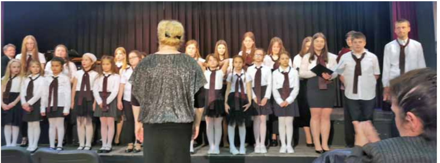
Szécsény Város Gyermekkara