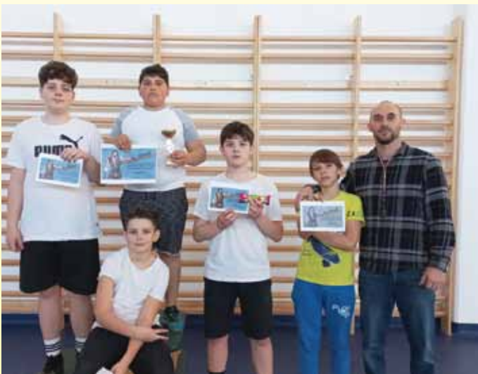
Toldi - fiúk III. korcsoport

Napjainkban a klímaváltozás miatt egyre több figyelmet kell fordítanunk a környezettudatos nevelésre. Ennek érdekében évente több olyan eseményünk is van, amellyel formálni lehet a tanulók szemléletét és még élvezhetik is az adott programokat (pl. papír-