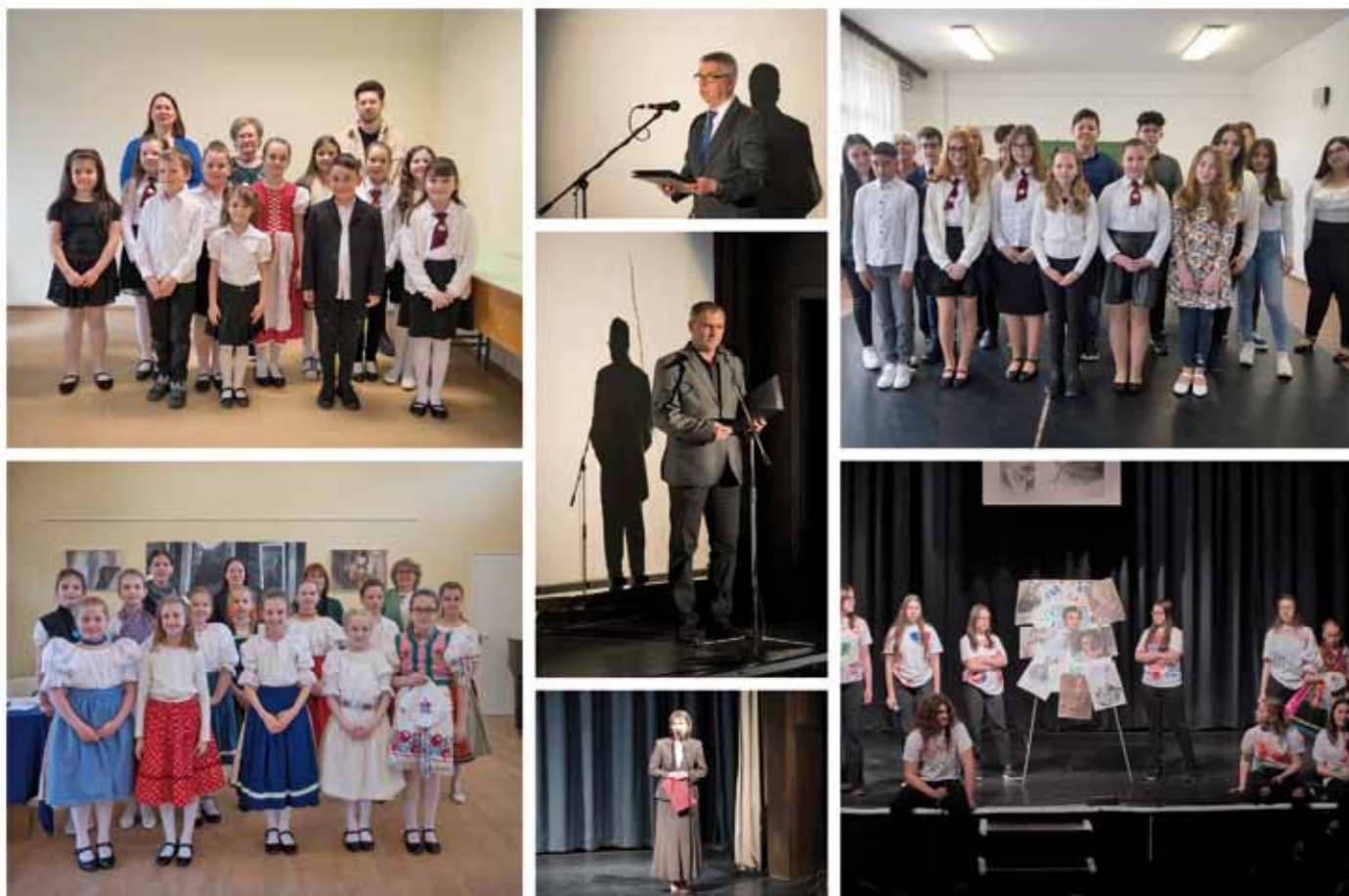
Pillanatképek a versenyről