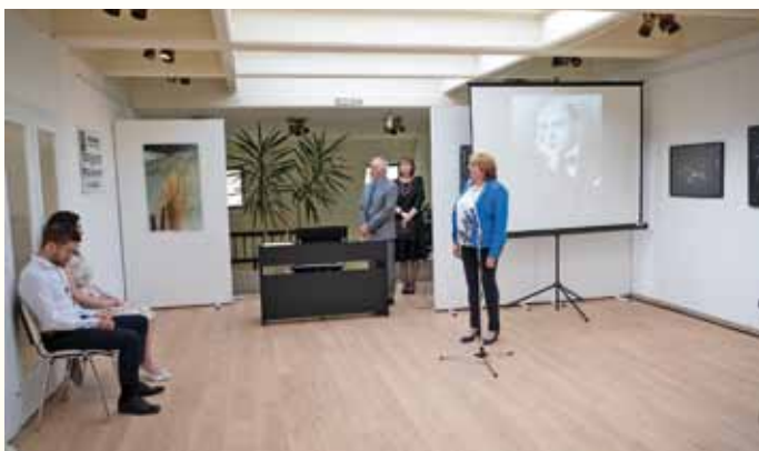
Az emléktábla szövegének felolvasása