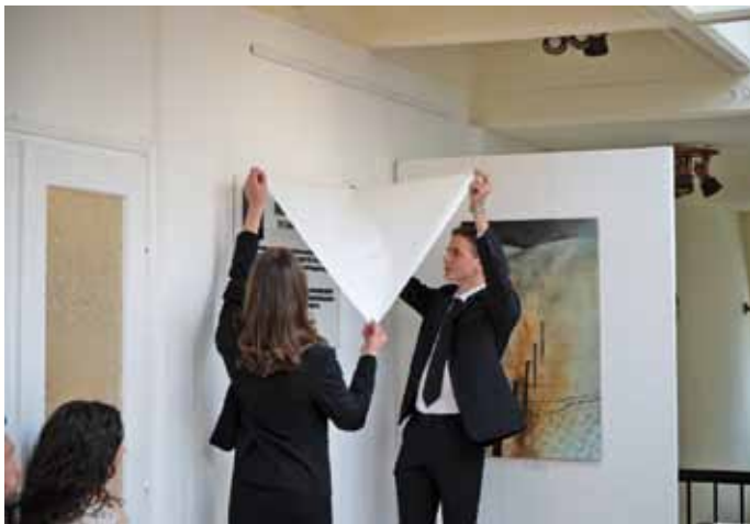
Az emléktábla leleplezése