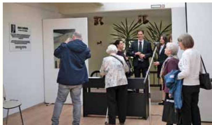
Az emlékezők megtekintik az emléktáblát

Szécsény városának elismerése. Nagyon szépen köszönjük!"