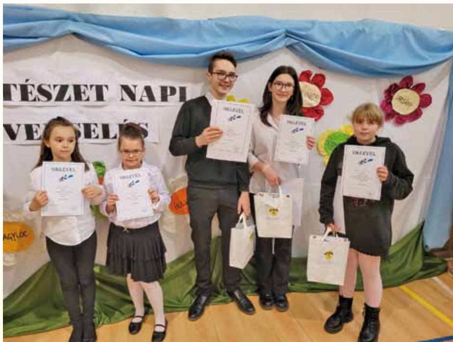
Szavalóverseny, rejtvényfejtő verseny díjazottjai