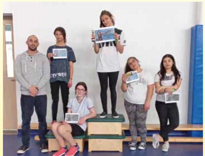
Toldi - lányok IV. korcsoport