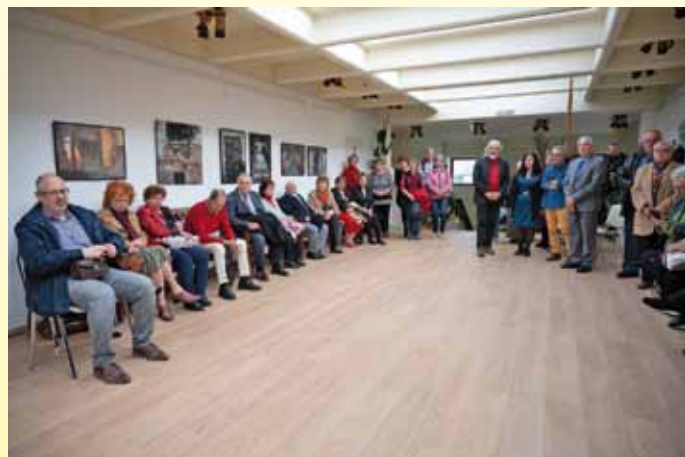
Az avatóünnepség közönsége