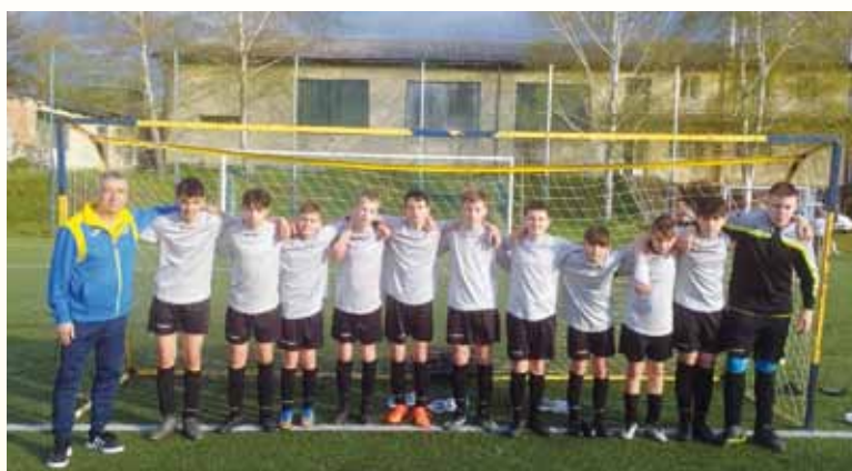
U14 Tiszai SE csapatkép