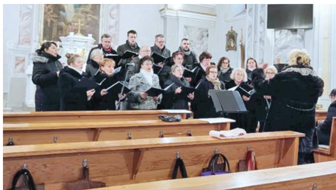
December 15. – Dejtár, adventi várakozás