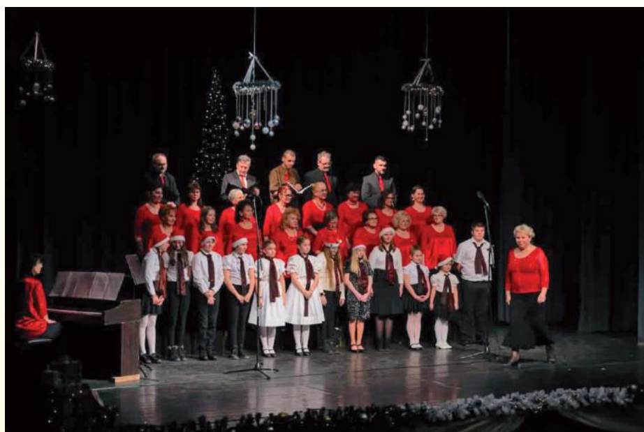
December 22. – városi karácsonyi műsor, Szécsény