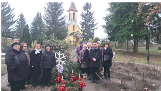
December 8. – Szügy, adventi gyertyagyújtás