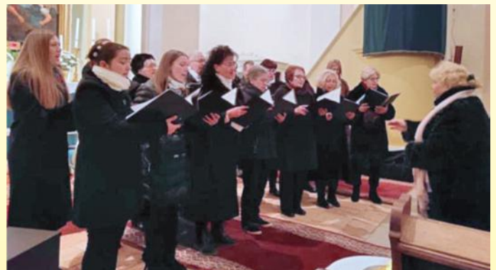
November 29. – Advent est (Szügy, evangélikus templom)