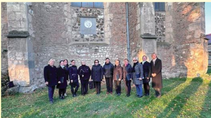
November 10. – megemlékezés Sobieski János emléktáblájánál