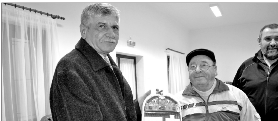
A pösténypusztai művelődési ház átadója