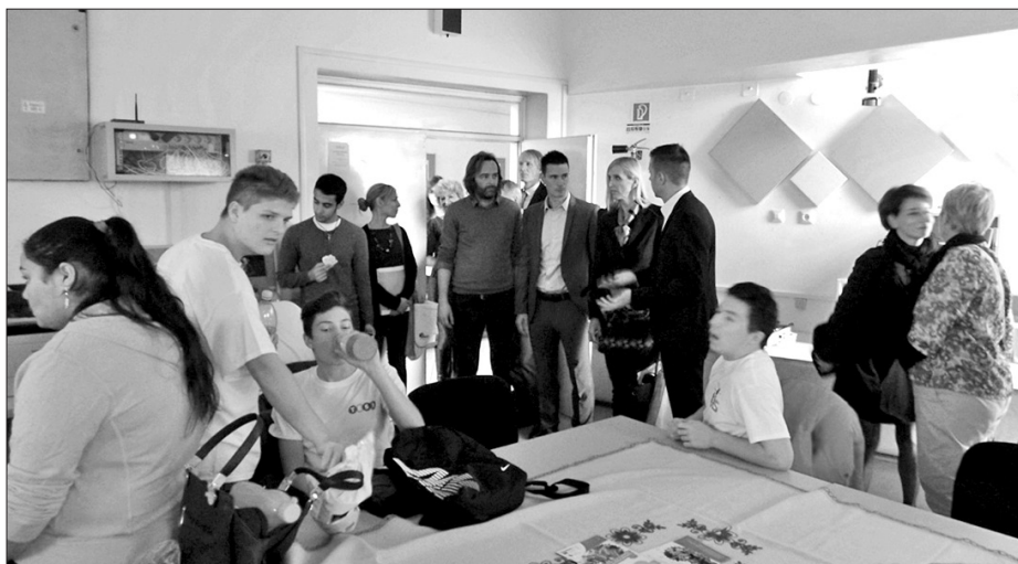
A vendégeink meglátogatták a TEIS KUCKÓT