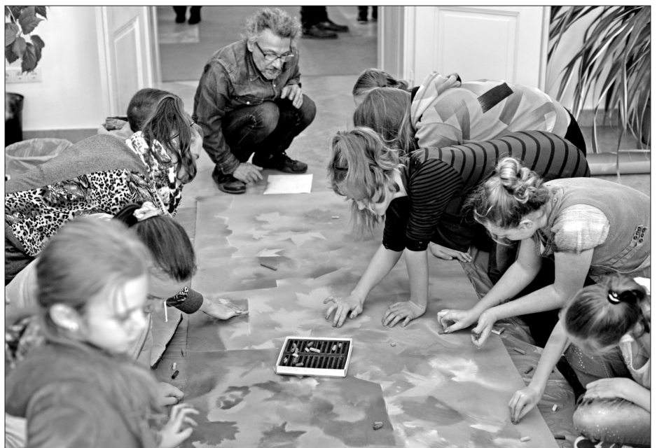
Közös rajzolás a múzeumban